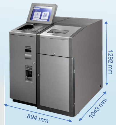
Peso: 924 Kg