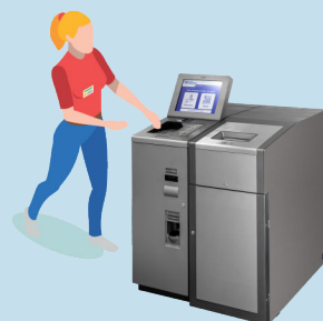
OPERADOR DE CAIXA