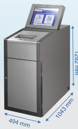
Peso: 621 Kg