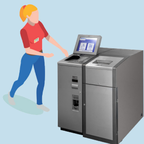
OPERADOR DE CAIXA