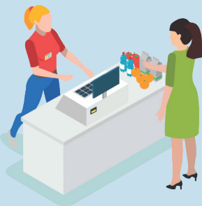
OPERADOR DE CAIXA