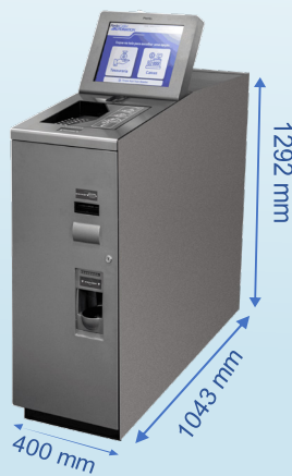
Peso: 303 Kg