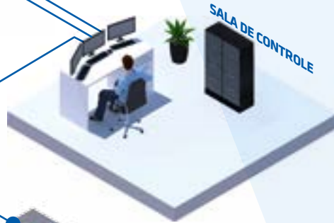
SALA DE CONTROLE

Com as opções de pagamento assistido (1) , cancela (3) e câmera (4) você já pode ter uma maior gestão da sua operação, minimizando evasões, potencializando o seu espaço e aumentando a sua rentabilidade.