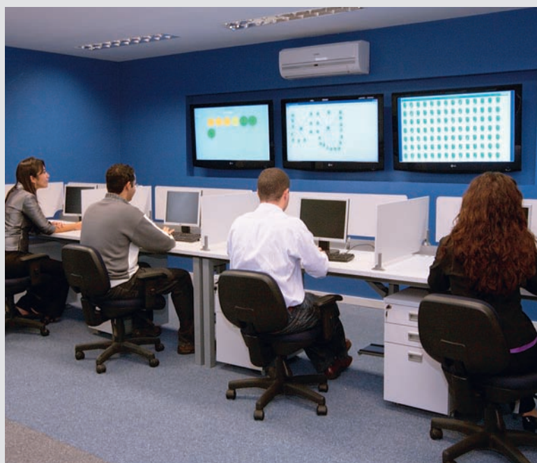
Estrutura de desenvolvimento de softwares alia tecnologia e conhecimento