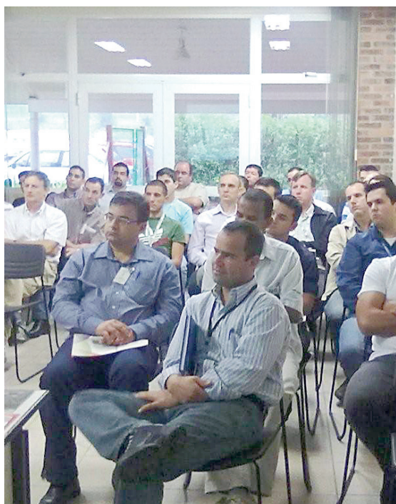
A palestra reuniu representantes de diversos setores

O objetivo da palestra foi auxiliar a empresa a conhecer e garantir a confiabilidade de seus produtos. Atualmente, a Perto conta com uma área específica para esse fim, a Engenharia de Confiabilidade e Qualidade, além de um Laboratório de Ensaio e Testes, com a proposta de aprimorar a performance e durabilidade de seus produtos.