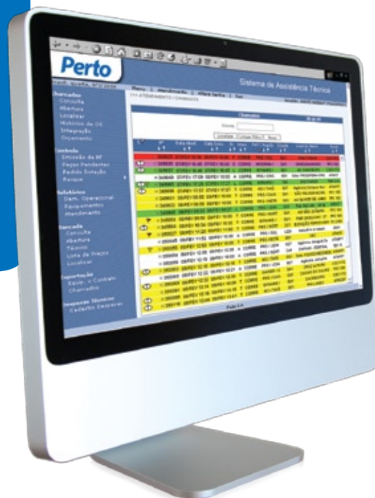
SAT - Sistema de Assistência Técnica Web

Para atender a cada cliente com agilidade, a Perto possui Centrais de Atendimento em Gravataí, Florianópolis, Curitiba, Barueri, Ribeirão Preto, Belo Horizonte, Brasília, Cuiabá, Belém, Rio de Janeiro, Vitória e Salvador. Além de ampla cobertura e mais de 200 regiões de atendimento.